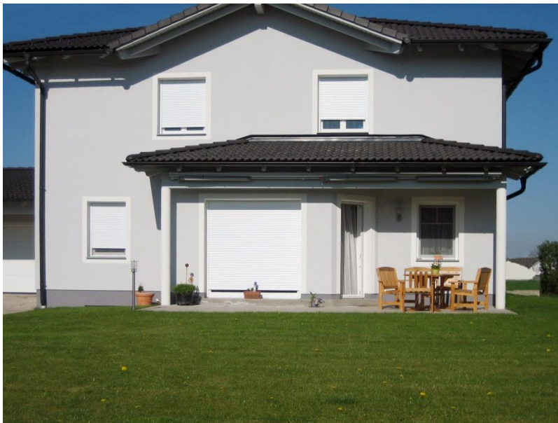
Bild 1: Der AK-Flex Aufsatzkasten von Alukon integriert sich unsichtbar ins Mauerwerk und somit harmonisch in die Gesamtgestaltung der Gebäudehülle. Die verschiedenen Behänge aus dem Alukon Programm sind in diversen Farben erhältlich.

Download Texte und Bilder: www.alukon.com/presse