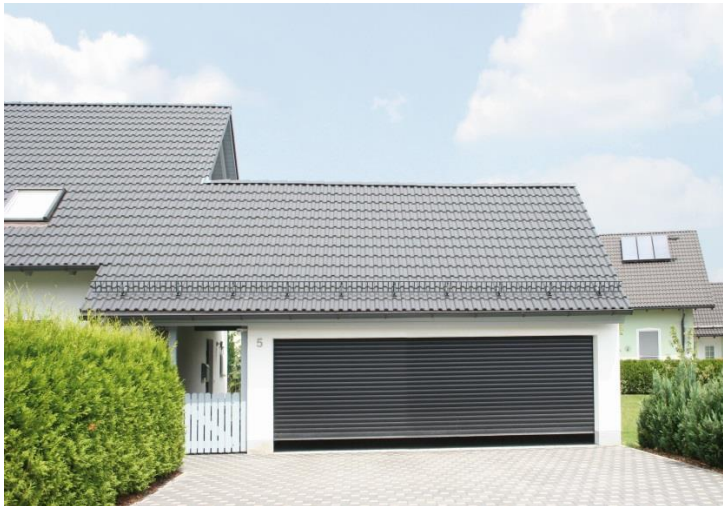
Bild 1: In Zeiten von Geländewagen muss die Garage ausreichend Platz bieten. Verlaufen im Deckenbereich zusätzlich Rohre oder wird dieser als Stauraum genutzt, empfiehlt sich der Einsatz eines Rolltores. Zur BAU 2015 präsentierte Alukon ein Garagenrolltor, das je nach Breite bis zu 4,40 Meter hoch und je nach Höhe bis zu 6 Meter breit erhältlich ist.