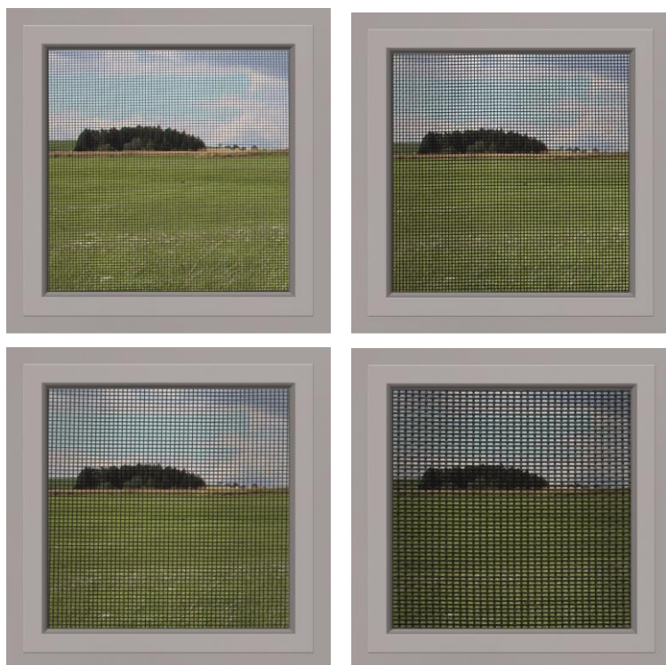
Bild 9: Die Insektenschutzlösungen von Alukon sind individuell mit verschiedenen Gazen erhältlich: Die Pollenschutz-, Durchblick-, Standard- oder reißfesten Gaze (von oben links

Download Texte und Bilder: www.alukon.com/presse