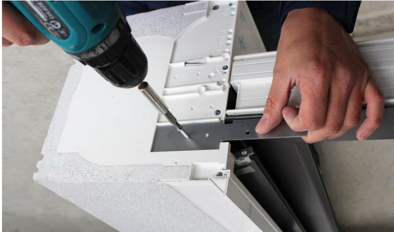
Bild 4: Passt die Positionierung, werden Befestigungslaschen rechts und links an die Kopfstücke des AK-Flex-Kastens und an den Blendrahmen des Fensters geschraubt.