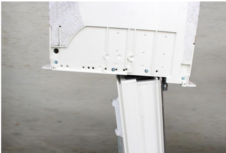
Bild 2: Nun wird der Kasten des AK-Flex auf dem Blendrahmen des Fensters positioniert und mit leichtem Druck, bis dieser vollständig und hörbar (Clickgeräusch) einrastet, in das Adapterprofil eingedrückt. Somit ist der AK-Flex-Kasten über die gesamte Breite schlüssig mit dem Fenster verbunden.

Bild 1: Im ersten Montageschritt wird das AK-Flex Adapterprofil auf dem Fensterprofil eingerastet, um dauerhafte Winddichtheit im System zu garantieren. Die Positionierung des Adapterprofils lässt sich dabei mit Hilfe der Bohrschablone erleichtern. Diese rastbare Verbindung eignet sich für alle gängigen PVC-Fenstersysteme. Für Holz- und Aluminiumfensterkonstruktionen kommt ein schraubbares Adapterprofil zum Einsatz, welches mit dem Fensterrahmenprofil verschraubt wird.