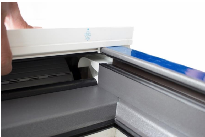
Bild 7: Daraufhin werden die Führungsschienen nach oben in Richtung Kasten geschoben, bis das Einlauftrichterunterteil hörbar in das Oberteil des Einlauftrichters einrastet.