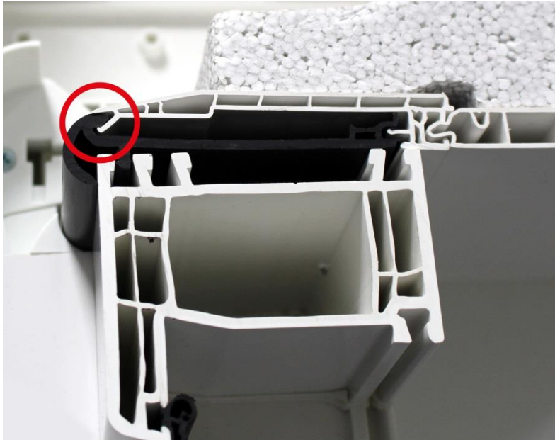
Bild 3: Anschließend wird der Kasten auf die richtige Positionierung überprüft, sodass das Adapterprofil und das Basisprofil des Kastens bündig abschließen.