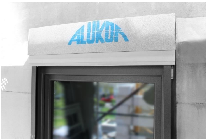
Bild 8: Nun wird vorkomprimiertes Dichtband am AK-Flex-Kasten und um den Blendrahmen geklebt und das komplette System anschließend in die Laibung eingesetzt. Im letzten Schritt wird ein Testlauf durchgeführt und die Montage des AK-Flex hiermit abgeschlossen.

Download Texte und Bilder: www.alukon.com/presse