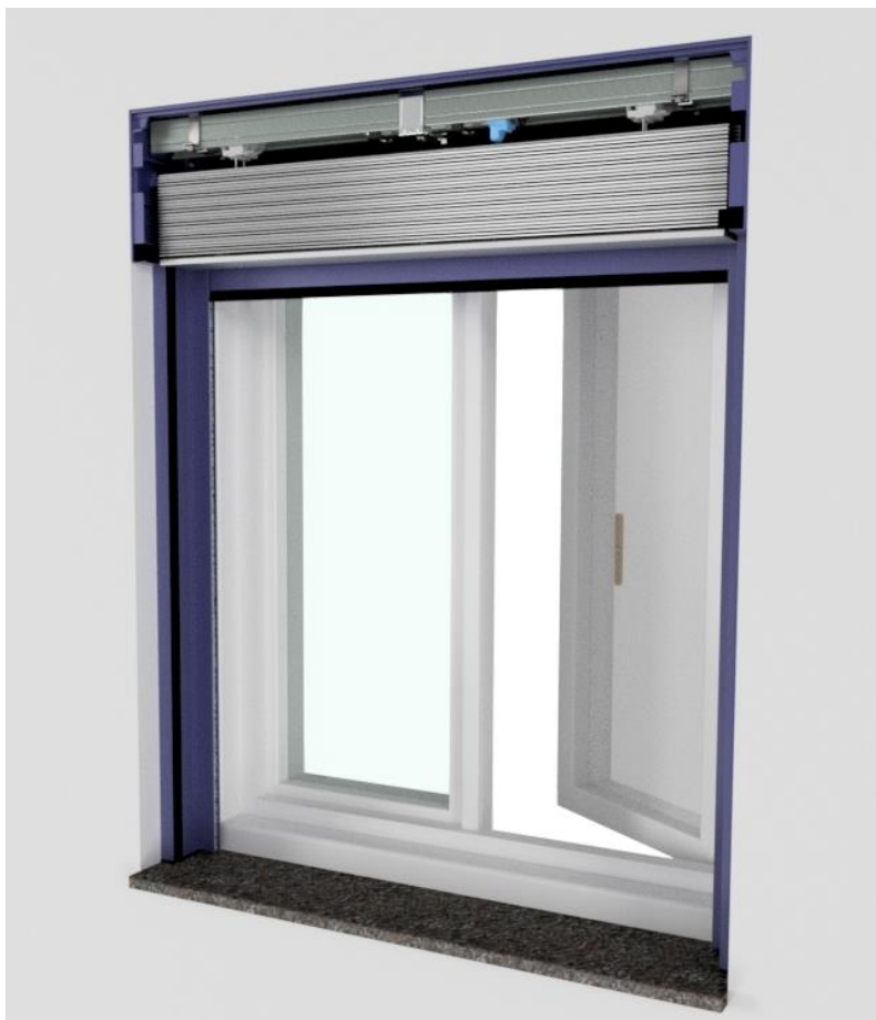
Bild 1: Raffstoren sind aufgrund ihrer individuell einstellbaren Tageslichtlenkung und Sichtschutzmöglichkeit ein sehr beliebter Behang. In Form des RAFF-E hat Alukon einen speziell für Raffstoren geeigneten Kasten entwickelt, der sich vor allem durch Montagefreundlichkeit auszeichnet.