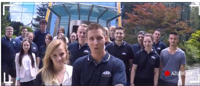
Bild 3 und 4: Mit einer eigenen Facebook-Seite und YouTube-Videos der Auszubildenden, fördert Alukon den direkten Austausch zwischen den jungen Nachwuchskräften.