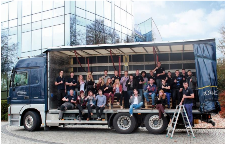
Bild 1: Ausbildung wird bei Alukon großgeschrieben: Der Hersteller aus Konradsreuth bildet in insgesamt 15 Berufen und einem dualen Studiengang aus und bietet jungen Nachwuchskräften ein attraktives Ausbildungsprogramm.

Engagement für die Fach- und Führungskräfte von morgen: